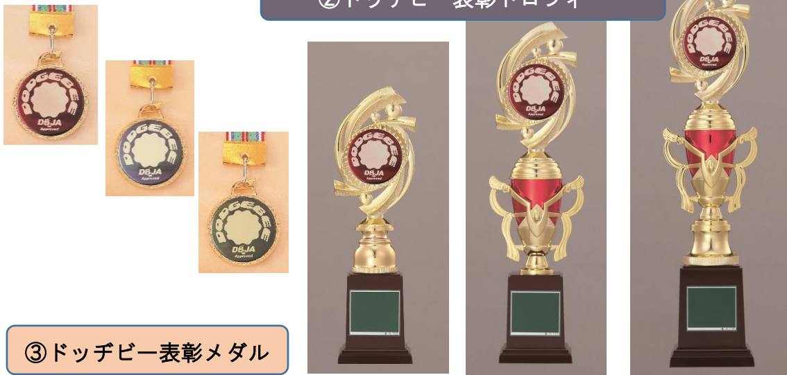
③ ドッジビー表彰メダル